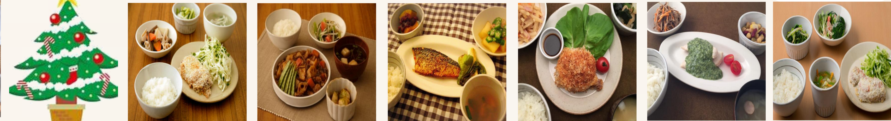
7日 8日 9日 10日 11日 12日 13日