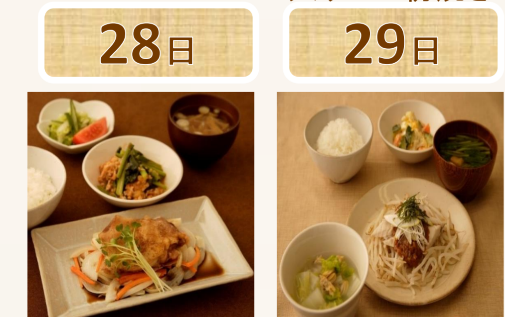
鮭の和風マリネ チキンのオリーブオイル焼き さわらの梅蒸し