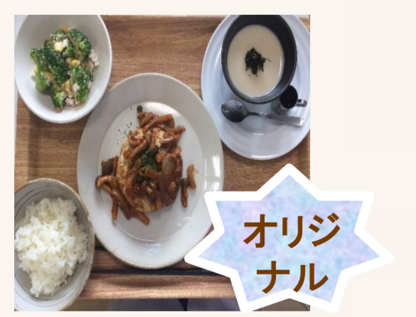
オリジナル レンコン ハンバーグ