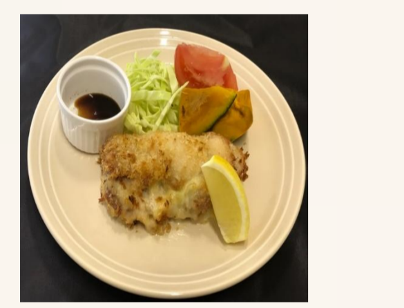
一汁二菜 揚げないチーズ チキンカツ