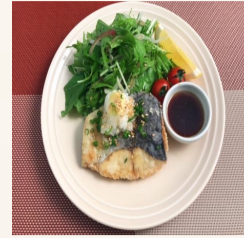
さわらの竜田揚げ さっぱり梅ごま おろし添え