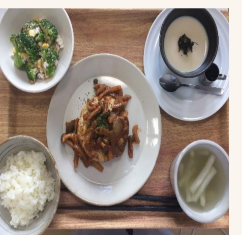
北九州オリジナル レンコン ハンバーグ