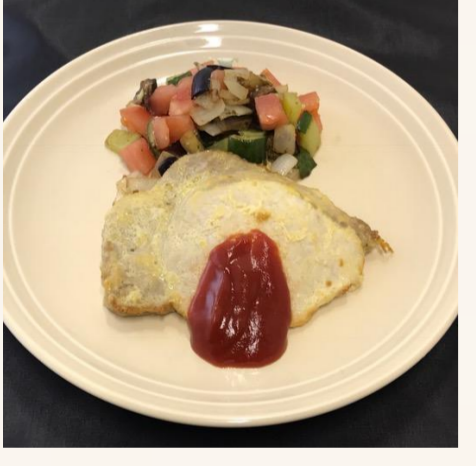
一汁二菜 ポークピカタ