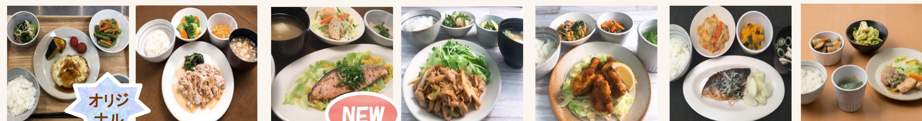
野菜たっぷり鶏バーグ