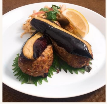
山椒香る丸ごと秋茄子の豚ひき肉はさみ焼き