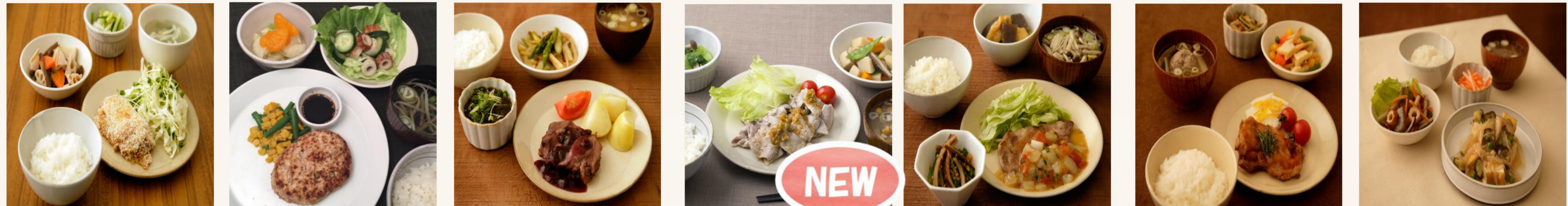
タンドリーチキン