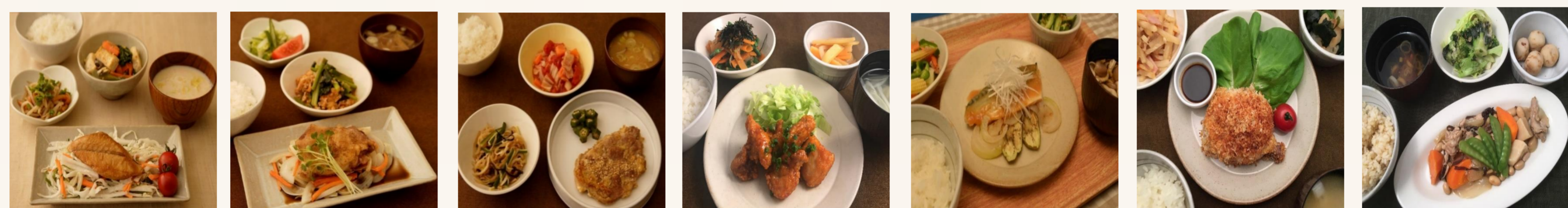
さわらの竜田揚げサラダ風