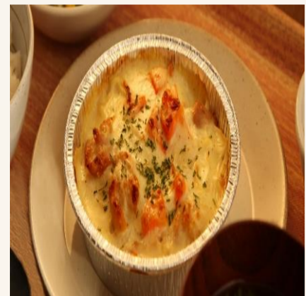
じゃが芋と鶏肉のグラタン