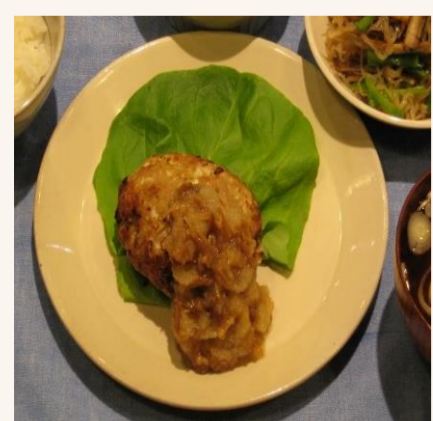
なめたけソースの和風ハンバーグ