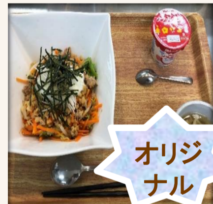
北九州オリジナルビビンバ丼