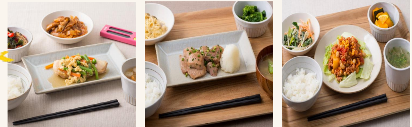
鶏肉の卵けんちん蒸し