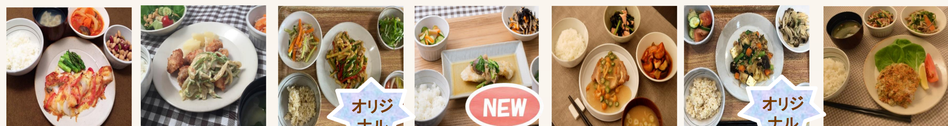
鮭のチーズペッパー焼き