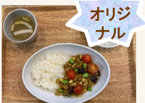
北九州オリジナルドライカレー