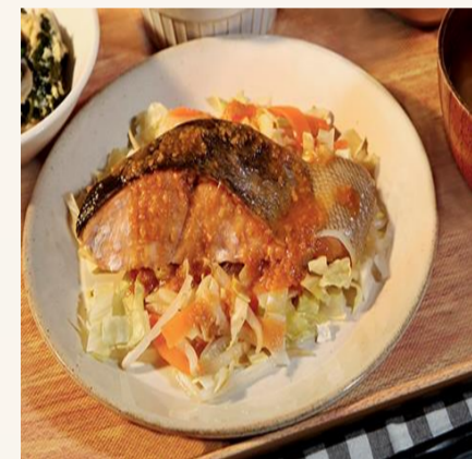
鮭のちゃんちゃん焼き